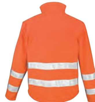
Fashionable shaped longer back panel