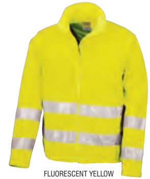
FLUORESCENT YELLOW (394)