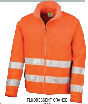
FLUORESCENT ORANGE (811)